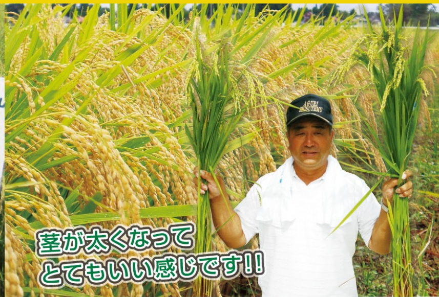
【生産者プロフィール】 サンライス青木 / 生産面積: 50ha / ファイト・アップ愛用: 5年