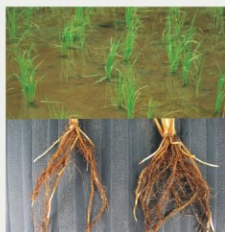
無処理区 ネバルくん区