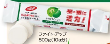
ファイト・アップ 500g(10分)